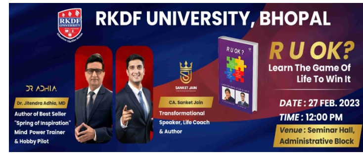
Seminar R U OK