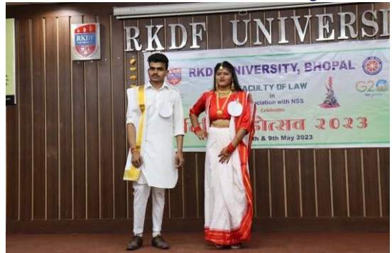
Vidhi Mohotsav Fancy Dress Competition