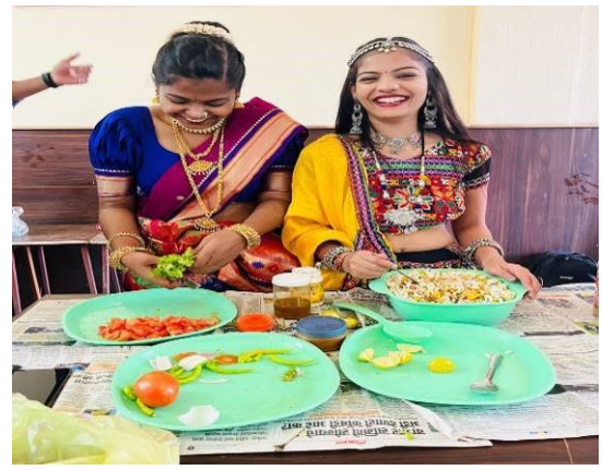
Food Festival – Flameless Cooking