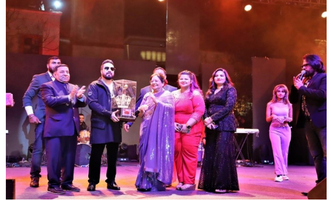
RKDF Foundation Day