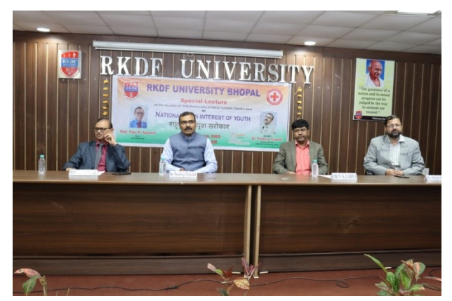
Seminar on National Interest of Youth