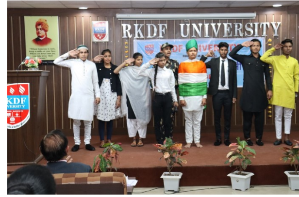
Aazadi Ka Amrit Mahotsav