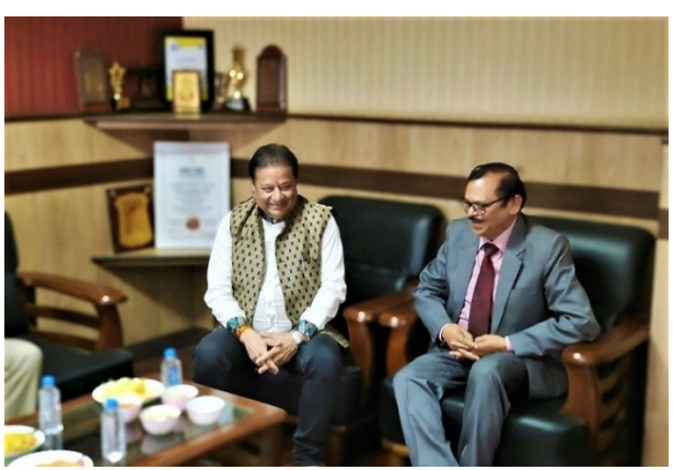
Shri Anoop Jalota in Campus