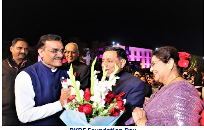
RKDF Foundation Day