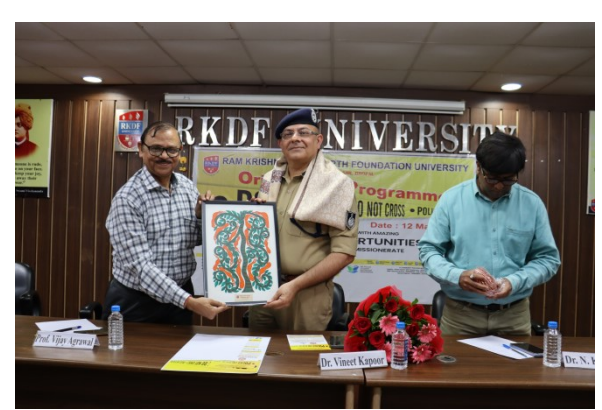
Seminar on Internship Opportunities with MP Police