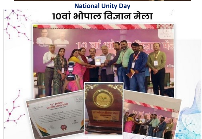
Vigyan Mela, 2023