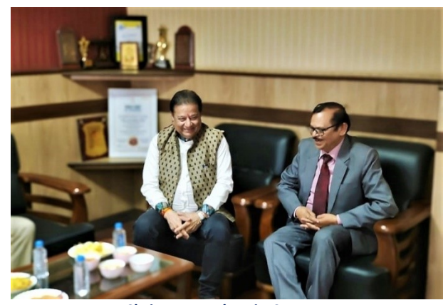
Shri Anoop Jalota in Campus