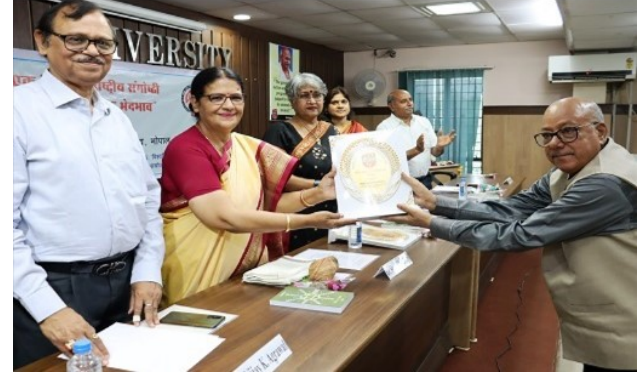
Seminar on Gender Discrimination