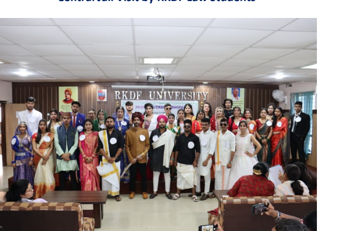
Vidhi Mohotsav Fancy Dress Competition