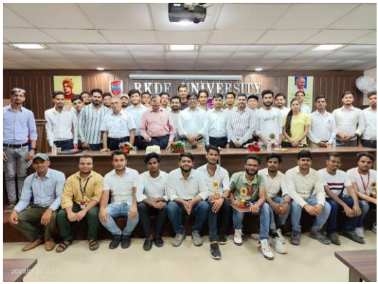
Farewell to Engineering Department