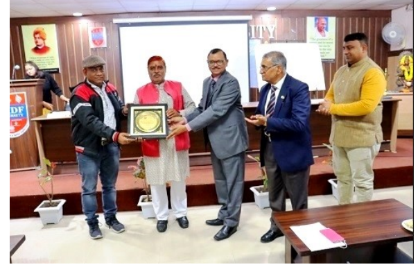
Seminar on Vedic Mathematics