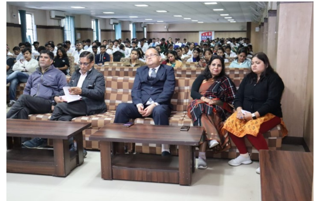
Seminar on National Interest of Youth