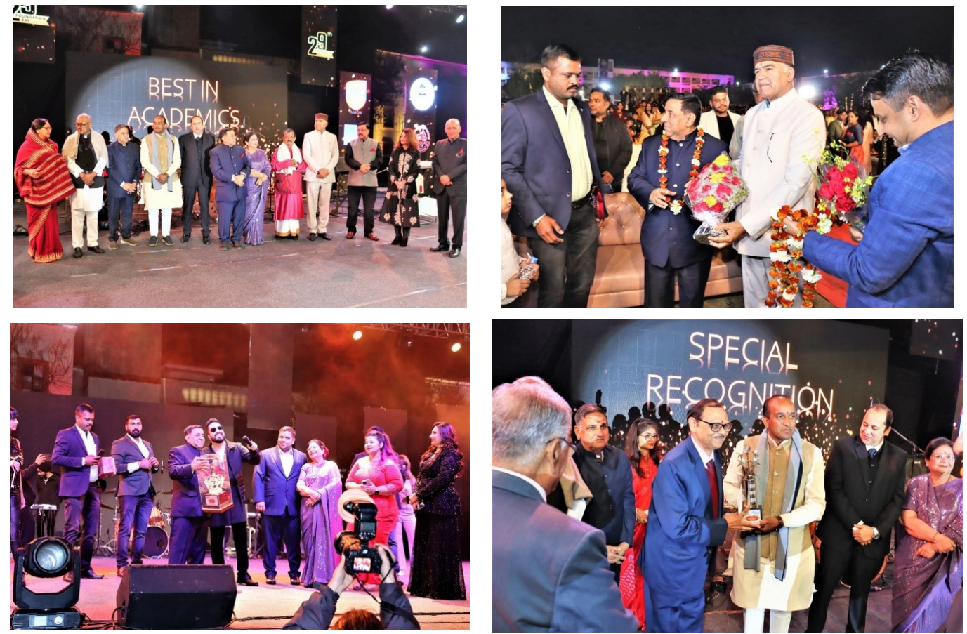
बॉलीवुड सिंगर मीका सिंह के गानों पर झूमे लोग